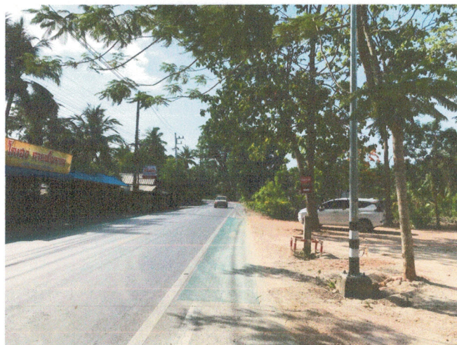
ลานจอดรถของร้าน