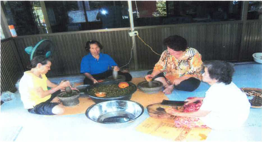
กิจกรรมทำลูกประคบ ถ่ายทอดศิลปะและภูมิปัญญา พื้นบ้านจากสมุนไพรไทย